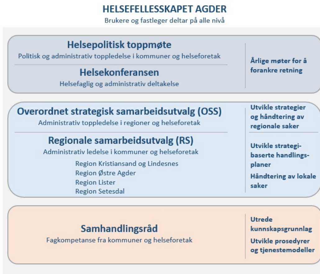
Figur 1: Helsefellesskapet Agder